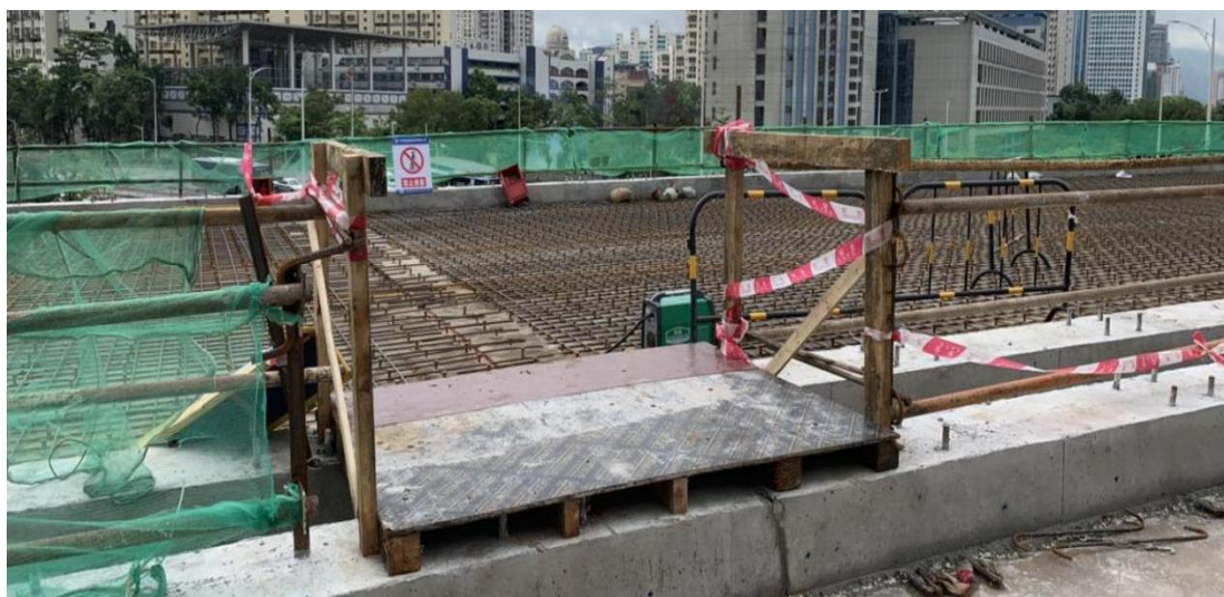
按照方案设置的通道

据现场勘查，设置有左右幅互通的过人通道，防护栏杆上悬挂了相关安全警示标识，符合施工方案设计。