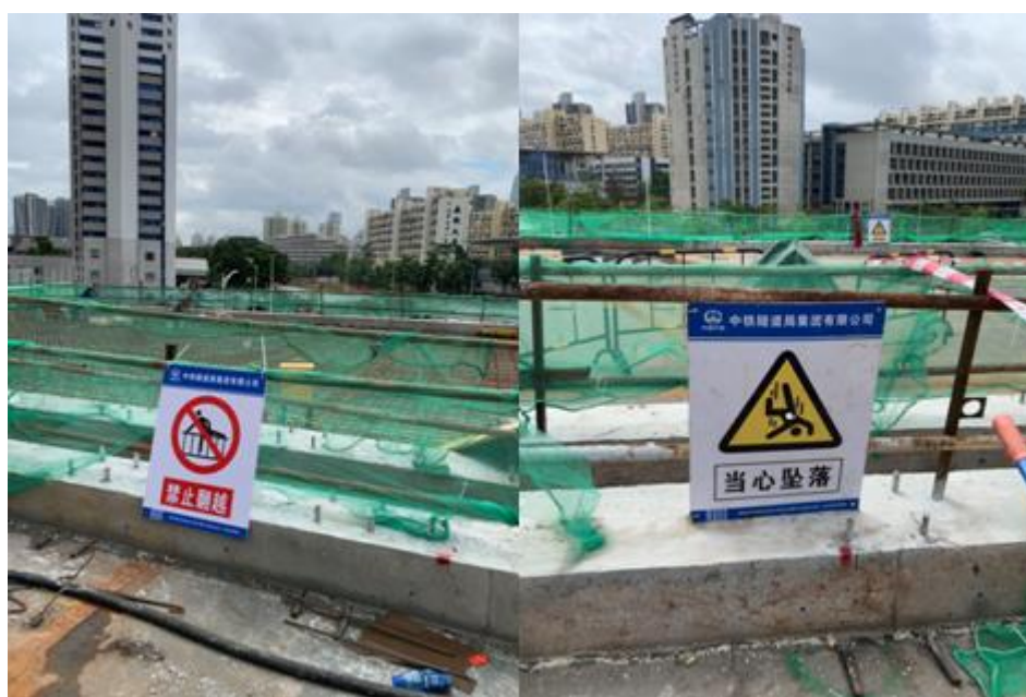
施工现场设置有安全警示标语