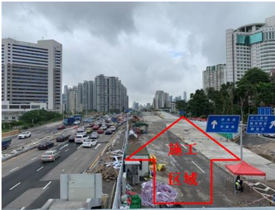
钢便桥现场南北走向图

事发时已设置道路封闭措施，已完成钢梁主体桥面安装，正在组织栓钉安装、钢筋绑扎和正式防护栏杆安装作业。